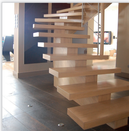
Schody Jaworski. Konstrukcja: schody zabiegowe na jednej belce. Balustrada: stal szlachetna, poręcz drewniana. Drewno: dąb bielony.