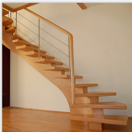
Schody Jaworski SJ 37. Konstrukcja: jedna belka. Balustrada: stal szlachetna, poręcz drewniana. Drewno: dąb.