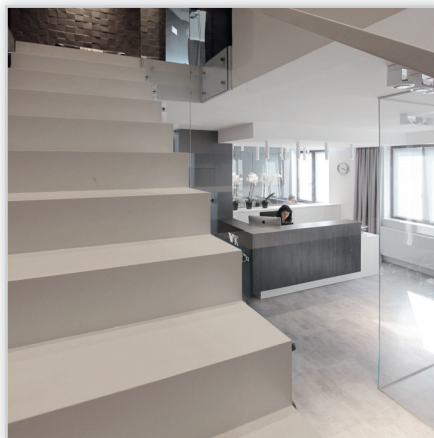
Schody Jaworski. Nowoczesne schody dywanowe. Balustrada: szyba z pochwytem drewnianym. Drewno: dąb malowany na biało.