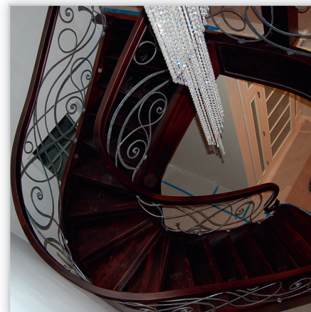
Schody Jaworski SJ15. Konstrukcja: policzkowa z podstopnicami. Balustrada: kowalstwo artystyczne. Drewno: orzech amerykański.