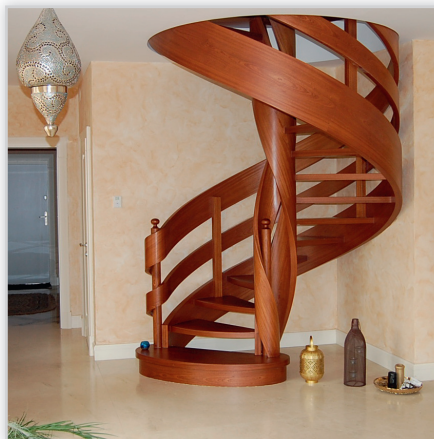
Schody Jaworski. Konstrukcja: policzkowa ażurowa. Balustrada: dwie wstęgi. Drewno: sapeli.