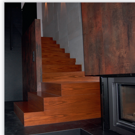
Schody Jaworski SJ 19. Konstrukcja: stopień-podstopień. Balustrada: szyba grafitowa. Drewno: iroko.