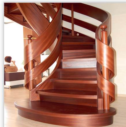
Schody Jaworski SJ 17. Konstrukcja: policzkowa stopień-podstopień. Balustrada: dwie wstęgi. Drewno: sapeli.